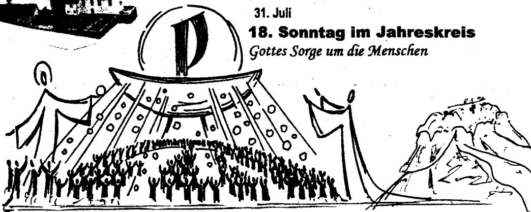
Bild links: All ihr Durstigen, kommt zum Wasser. Kauft Brot und esst. Kommt und kauft ohne Silber..“

18. Sonntag im Jahreskreis Gottes Sorge um die Menschen