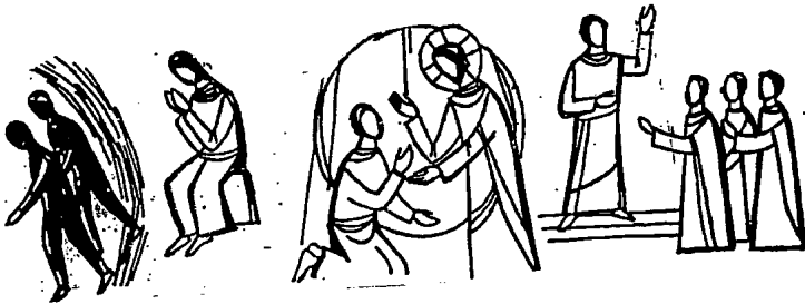
Bild links: 1. Lesung (Levitikus 13, 1–2. 45–46) DER AUSSÄTZIGE ... ist unrein und SOLL ABGESONDERT WOHNEN, außerhalb des Lagers ...

Wer vom Aussatz der Sünde befallen ist, ist vor Gott unrein und bringt auch seine Mitmenschen in Gefahr.