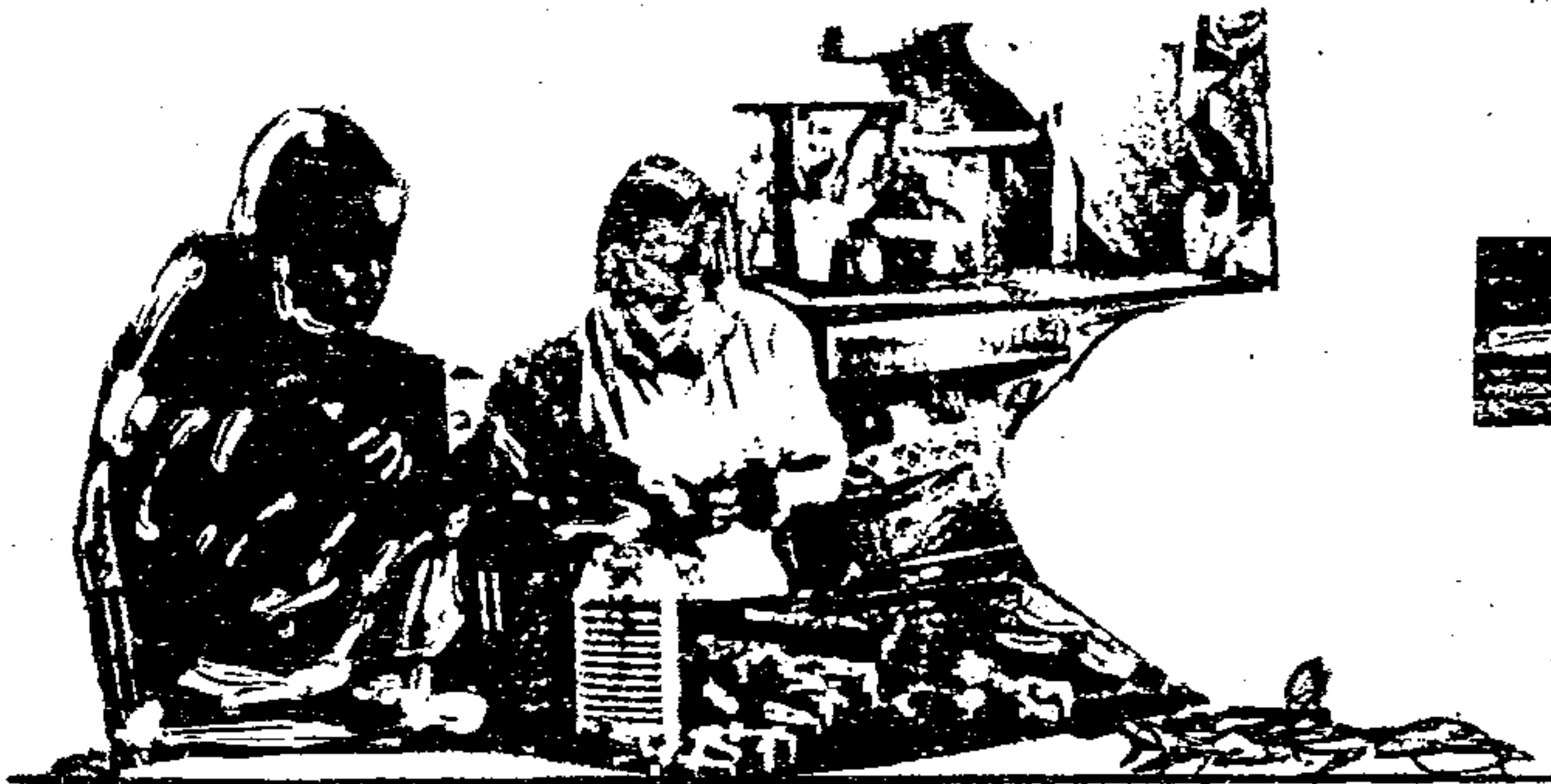
Mädchen in Lomin bei der Herstellung der Kreuzchen für die Christophorusaktion

Im Namen des Vaters und des Sohnes und des Heiligen Geistes. Amen